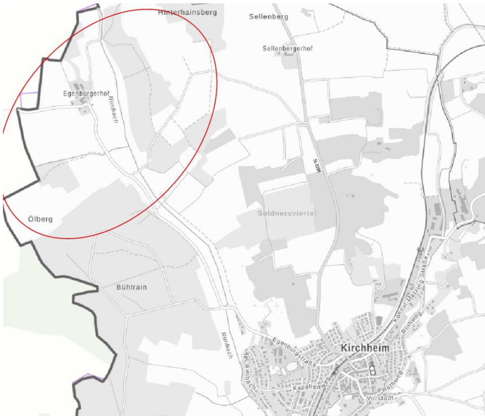
Abb. Übersicht Lage des Vorhabens