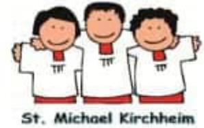
St. Michael Kirchheim