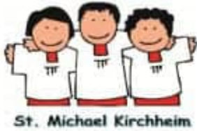
St. Michael Kirchheim