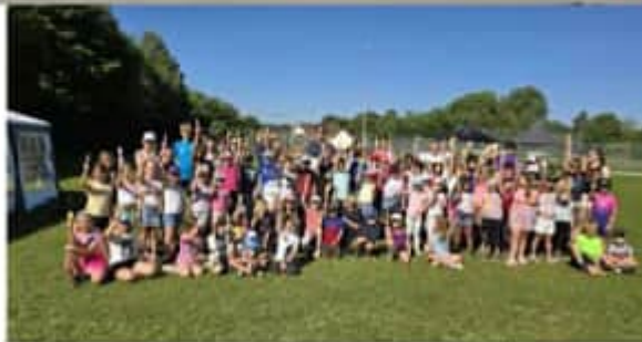
Genehmigungen für Bildaufnahmen liegen vor