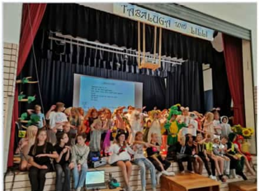
Text: A. Ludwig und M. Seubert

Sie erzählt von Tabaluga, dem Drachenkind, das das „wahre Feuer“ finden muss, um die Welt vor dem ewigen Eis des bösen Schneemanns Arktos zu beschützen. Der erschafft Lilli, ein schönes Mädchen, ganz aus Eis, um Tabaluga abzulenken. Mit wunderschönen Kostümen, tollen Tanzeinlagen und gelungenen Liedinterpretationen faszinierten die Chorkinder ihre Zuschauer. Groß und Klein fieberte aufgeregt einem glücklichen Ende der Handlung entgegen. Als Lohn für all die Anstrengungen gab es jede Menge Applaus.